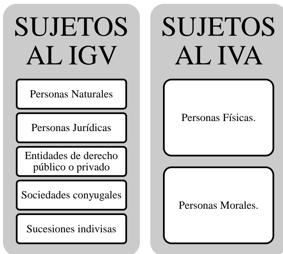
Figura 1: Sujetos al IGV y al IVA

La elaboración de selección es propia del autor