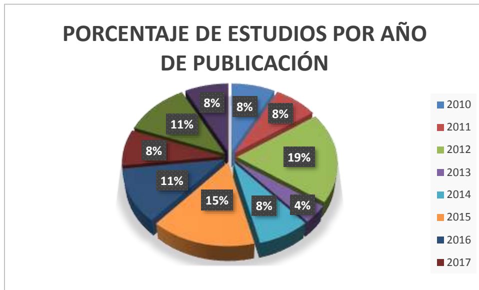
Figura 3: En este diagrama se resumen la cantidad de artículos encontrados entre el año 2009 al 2019, esto nos da una idea de la tendencia a la investigación en los últimos años y en que periodos se hicieron más estudios sobre el tema.

Figura 2: Tabla de la cantidad de estudios extraídos de acuerdo al tipo de documento, en el proceso de recolección de información después de la filtración según los parámetros ya mencionados anteriormente nos quedamos con 26 documentos de los cuales solo influyeron 20 de ellos que se precisaran más adelante.