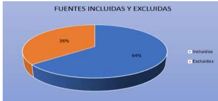
Grafico 2: Fuentes incluidas y excluidas