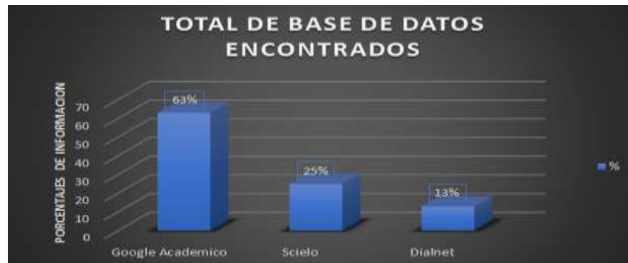
Grafico 1: Distribución de información encontrada

En la búsqueda de resultados en la base de datos que es de manera virtual y que arroja un total de 40 documentos extraídos de Google Académico (63%), Scielo (25%), Dialnet (13%), mediante los buscador Operador Booleano lógicos (AND, NOT, OR,) y las palabras claves Informalidad laboral, MYPES, crecimiento económico, formalización, derechos laborales.