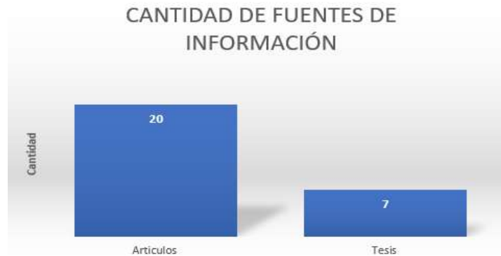
Grafico 4: Tipo de fuentes encontradas