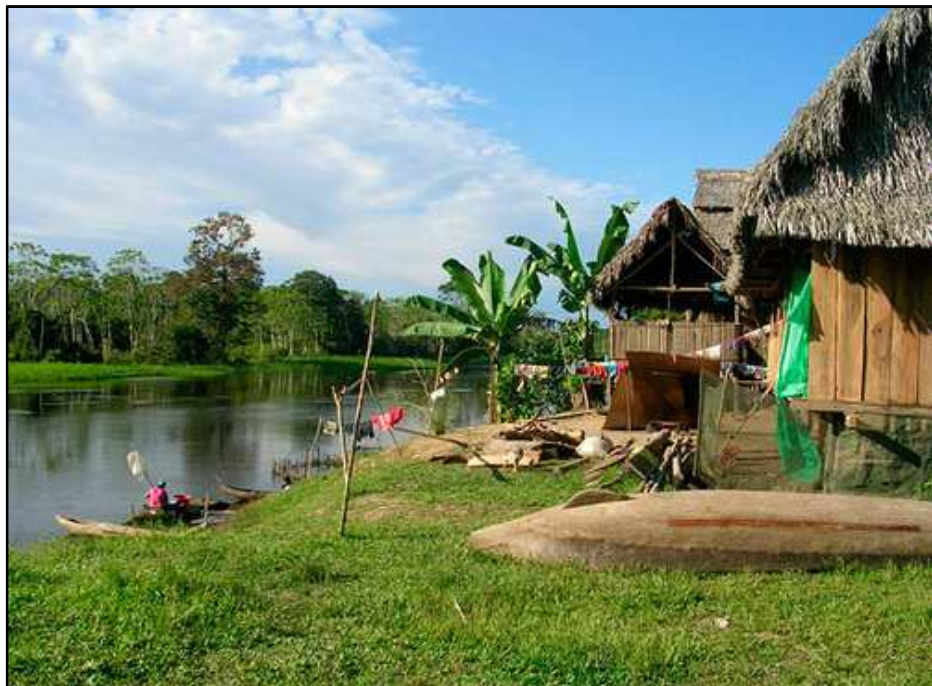
OCTAVA MIERCOLADA CULTURAL EN LA UPN