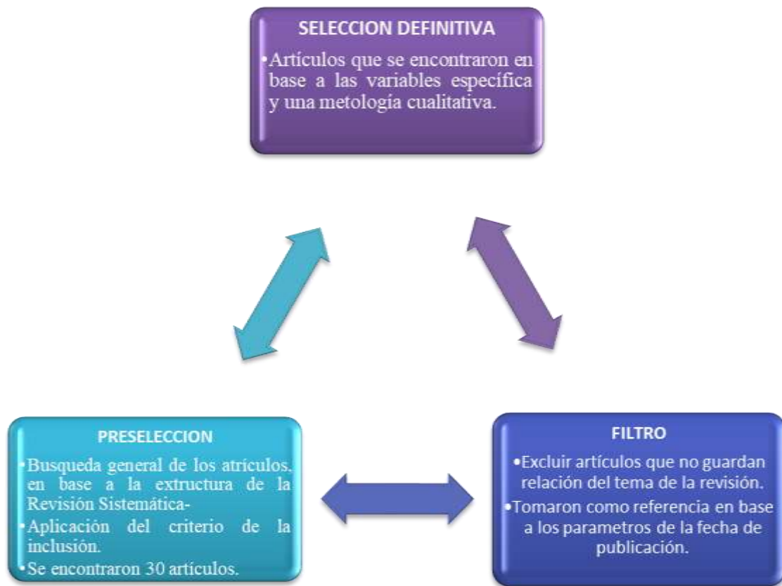
Figura N°0 1: Criterios de Inclusión y Exclución “Flujo de Caja -

De dichos artículos, se extrajeron diferentes metodologías de la investigación y se organizaron en una matriz para analizar sus semejanzas y diferencias las cuales se adecuaron para la realización de esta investigación.