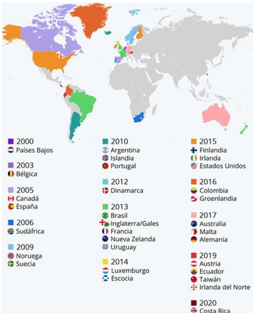
Grafico 3: Países que le dieron el Sí al matrimonio igualitario en el mundo