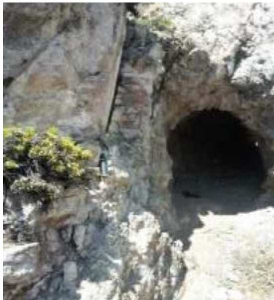
Foto 2: Socavón presencia de malaquita, cuprita, azurita, crisocola, hematita, limonita, Qz.