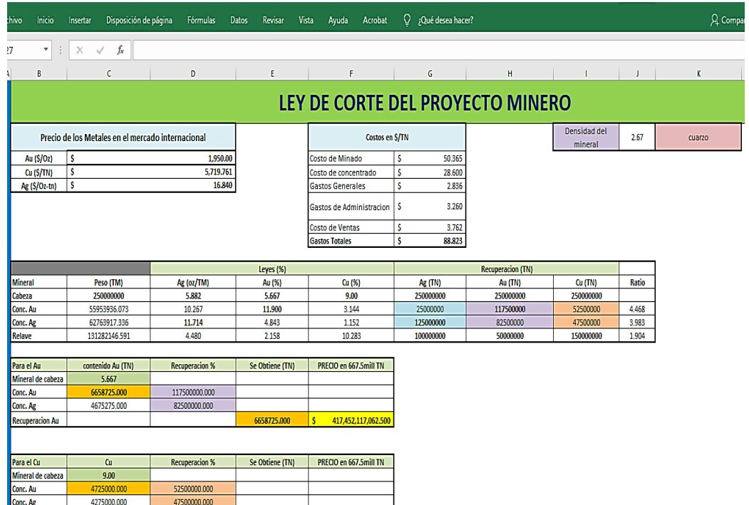
Figura 1: Data general - Ley de corte