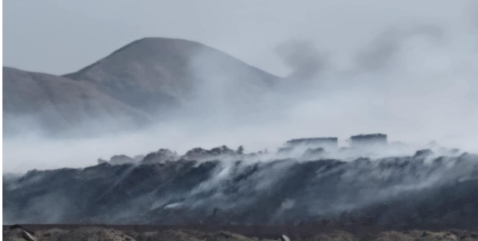
FOTO 06: ALTA CONTAMINACIÓN AMBIENTAL, LA CONBUSTIÓN DÍA Y NOCHE EN EL BOTADERO CONTROLADO DE EL MILAGRO