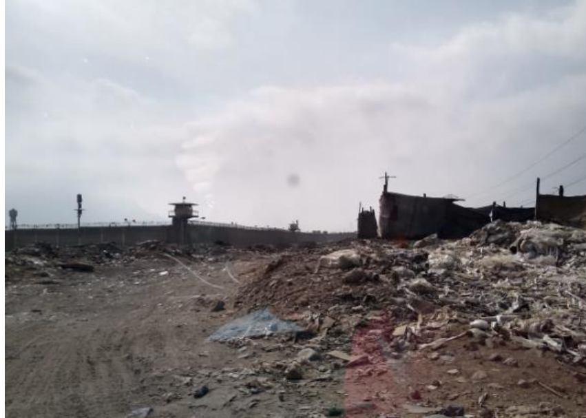
FOTO 05: POBLACIÓN RESILENTE ALEDAÑA INCLUYENDO EL PENAL DE EL MILAGRO