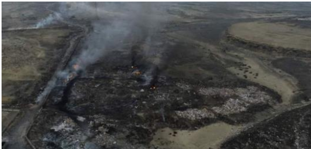
FOTO 07: ALTA CONTAMINACIÓN AMBIENTAL, LA CONBUSTIÓN DÍA Y NOCHE EN EL BOTADERO CONTROLADO DE EL MILAGRO