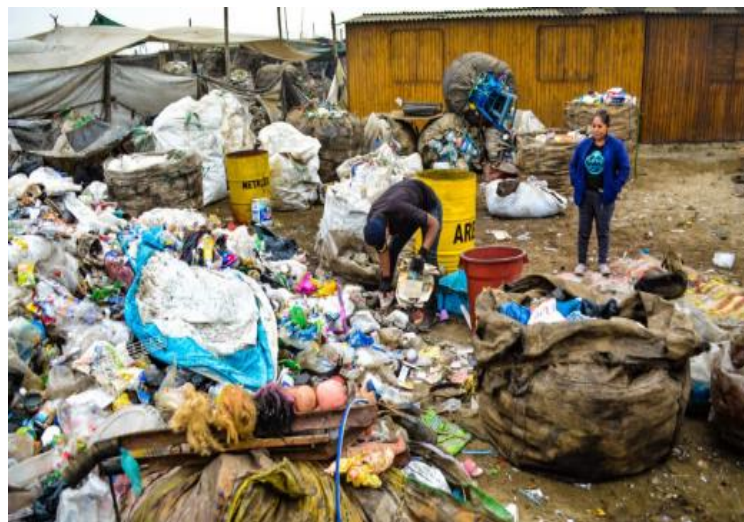
FOTO 06: POBLACIÓN RESILENTE EN LA POBLACIÓN ALEDAÑA INCLUYENDO VIVINEDAS