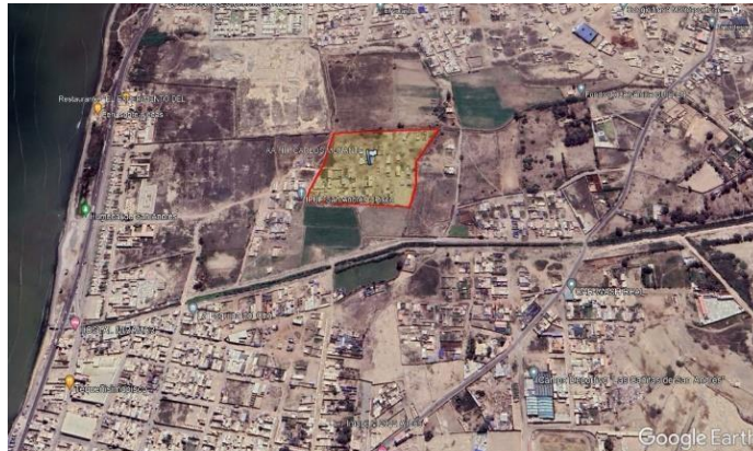
Figura 1: Ubicación en el Google Earth.

Para una vivienda de 7.00 x 20.00 m., para dos familias que alberga la vivienda, se distribuye tal como se muestra en la Fig.2. Asimismo, señalar que en este tipo de vivienda tiene un total de 84 m 2 construido con madera y techo cubierto entre calamina y planchas de triplay.