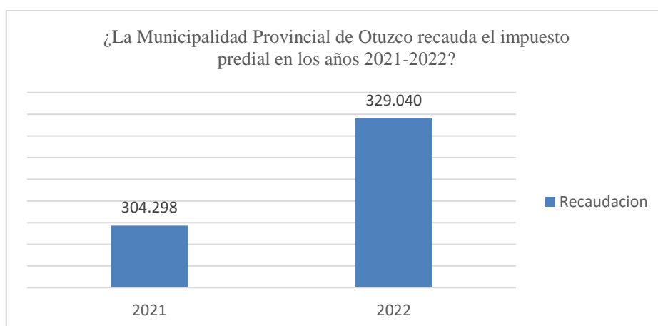
Figura 1 Recaudación del impuesto predial años 2021-2022.

Nota: Datos extraídos de la página amigable del MEF.