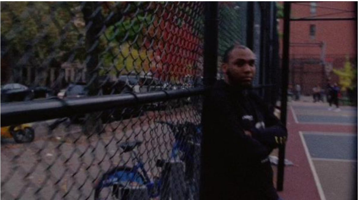
Figura 7. Latino en loza deportiva. Cliqua, 2018.