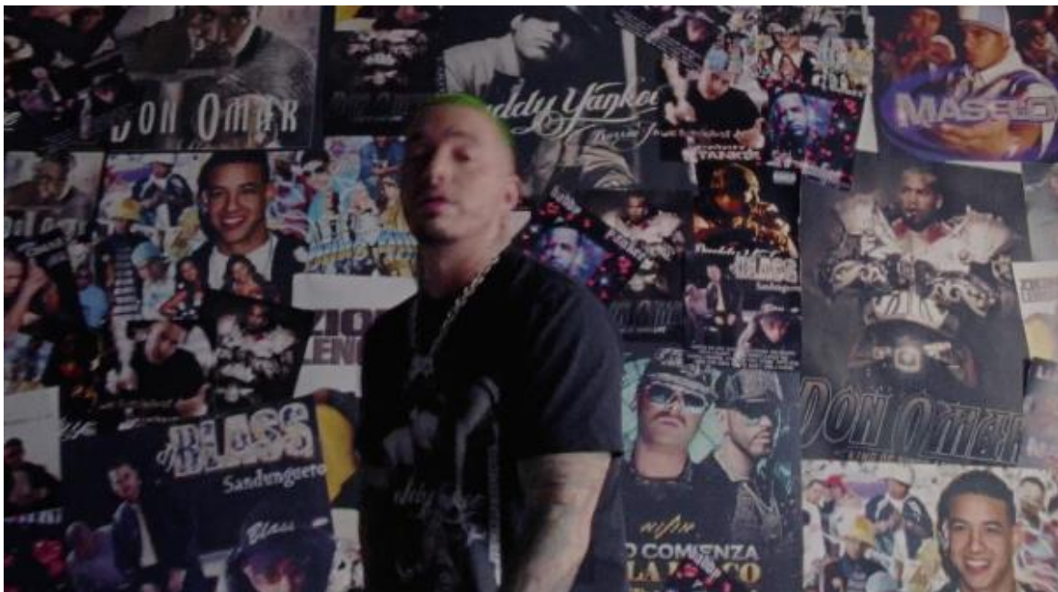
Figura 1. Balvin frente al muro de afiches. Cliqua, 2018.

Interpretación: Balvin les rinde homenaje a los pioneros del reggaetón tanto en la letra como en la amplia variedad de afiches detrás suyo. La letra de la canción es sencilla, pero el trasfondo es amplio, tanto el de la canción como el que presenta las tomas dentro de la habitación con afiches. Es como estar en un salón de la fama del reggaetón antiguo.