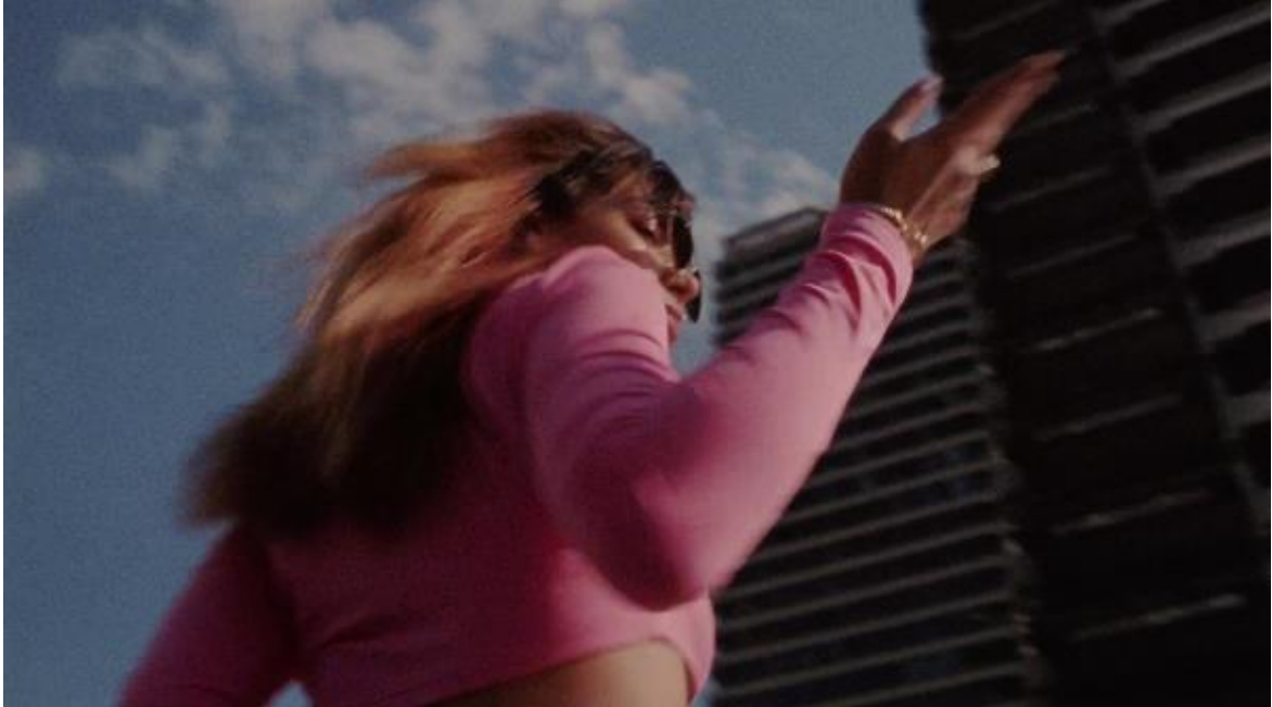
Figura 4. Modelo bailando en cielo despejado. Cliqua, 2018.

toma final contrapicada de él y su equipo en un edificio, mostrado como una torre prominente.