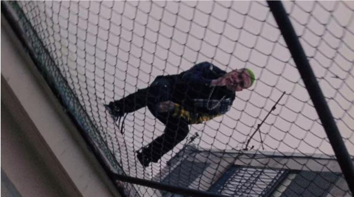
Figura 13. Yo te he visto fumando krippy. Cliqua, 2018.