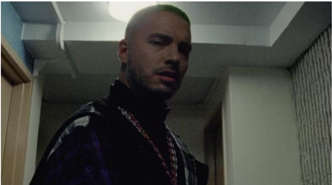
Figura 5. Aparición corta de Balvin. Cliqua, 2018.