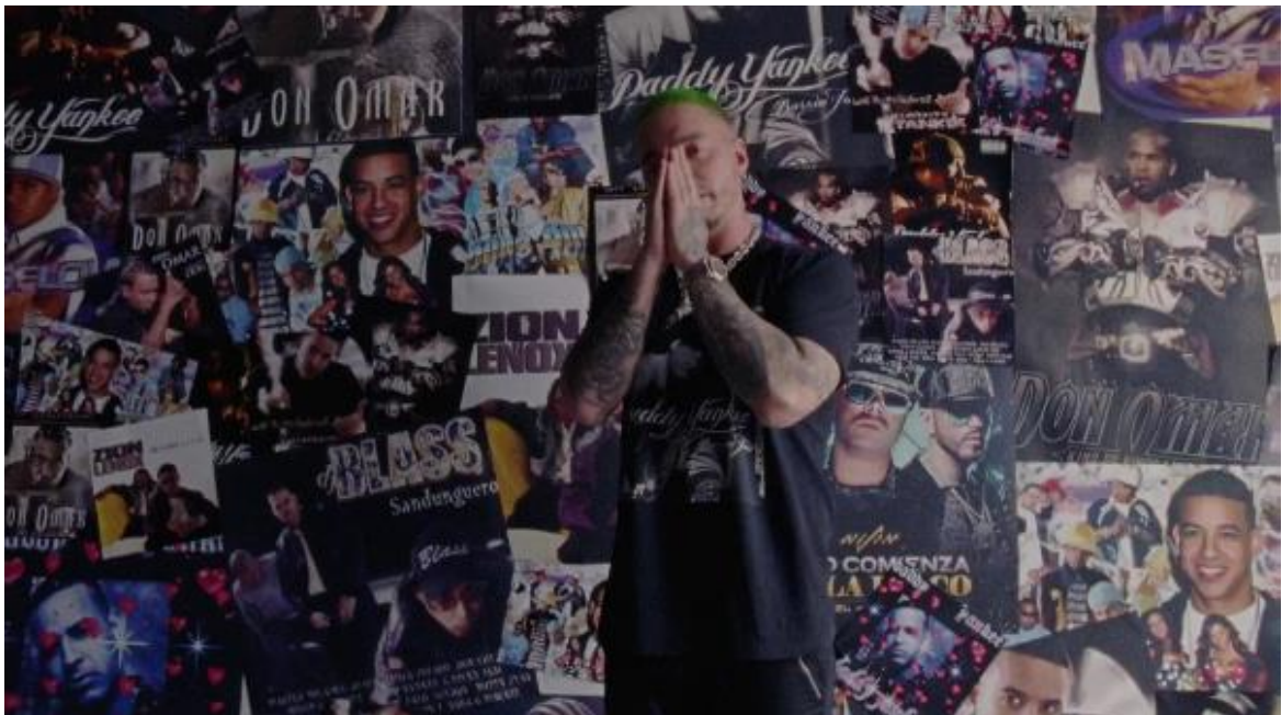
Figura 3. Continuación de la alabanza de Balvin. Cliqua, 2018.