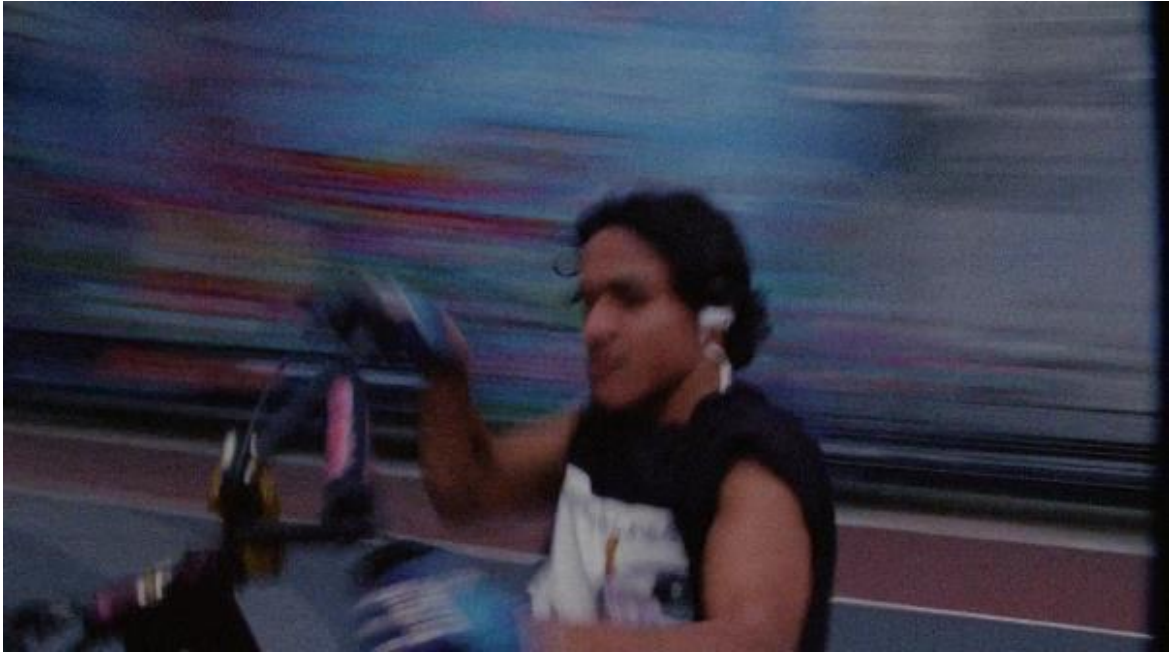
Figura 6. Ciclista en East Harlem. Cliqua, 2018.