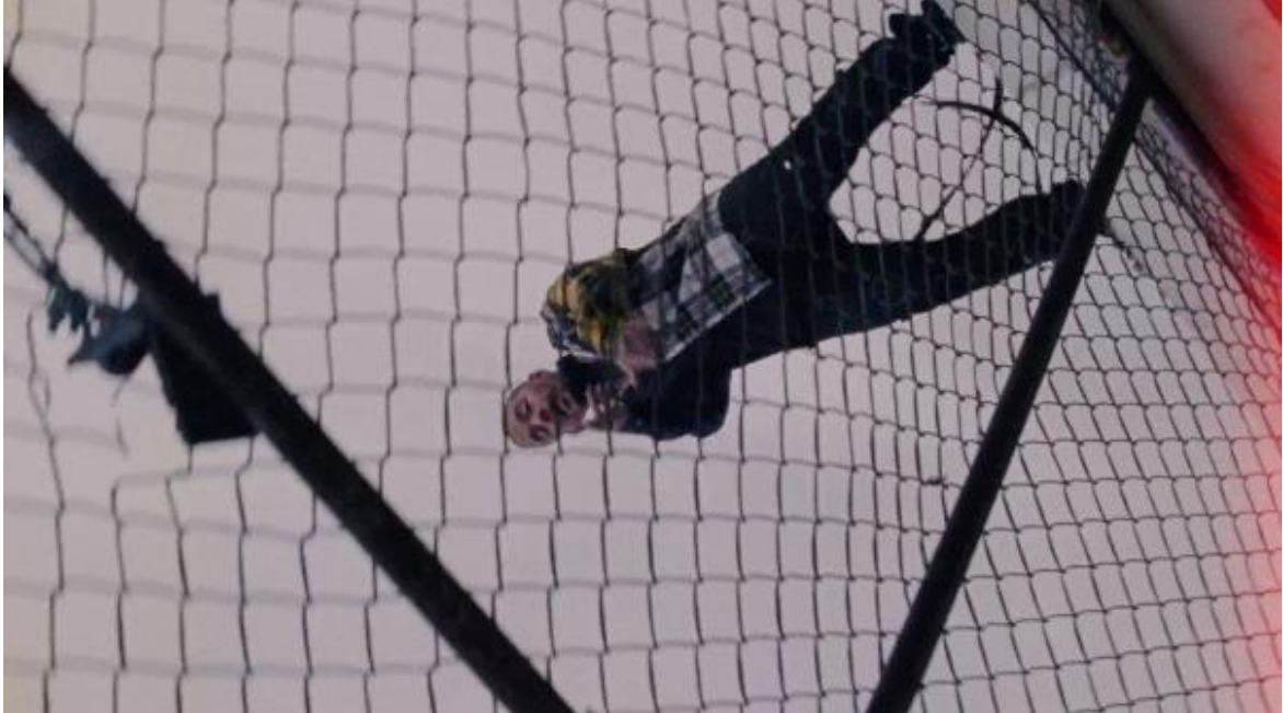
Figura 11. J Balvin en ángulo aberrante. Cliqua, 2018.

acento para una estrofa de temática pícaro y atrevida. El uso de transiciones rápidas que muestren paisajes de East Harlem recuerda que nos encontramos en un vídeo sobre ellos y su cultura.