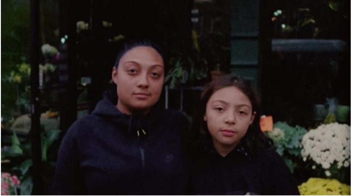
Figura 8. Madre e hija afuera de florería. Cliqua, 2018.