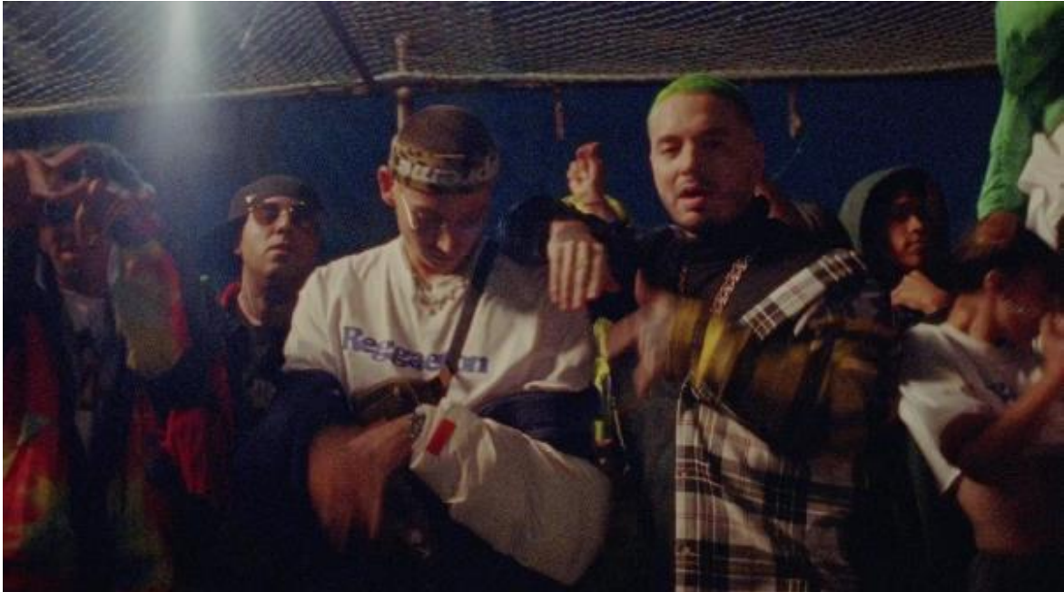
Figura 14. Comunidad Reggaeton. Cliqua, 2018.

y se convierte en un miembro de su propia comunidad, conformada por él, su equipo de trabajo y sus bailarines, es decir, él y su séquito. Ahora las modelos y la mayoría del equipo visten más casual y disfrutan más el momento. El ambiente se vuelve más amigable.