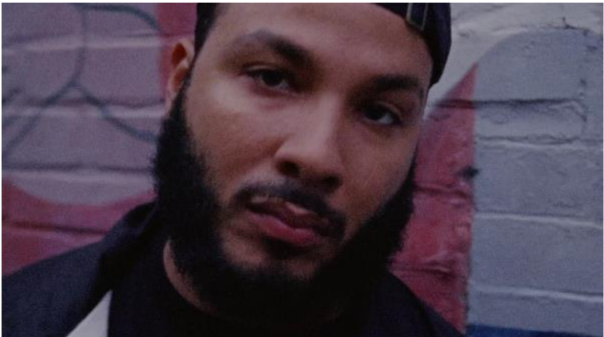
Figura 9. Retrato callejero. Cliqua, 2018.