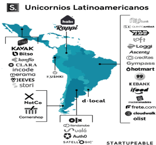
Fig. 1 Ranking startups unicornio.

Al revisar el top de Start-ups, o conocidos como unicornios, observamos que están estrechamente relacionados al rubro de servicios; empresas como Rappi y Loggi del rubro logístico, Nubank del sector Fintech, Cornershop del sector Marketplace entre otros.