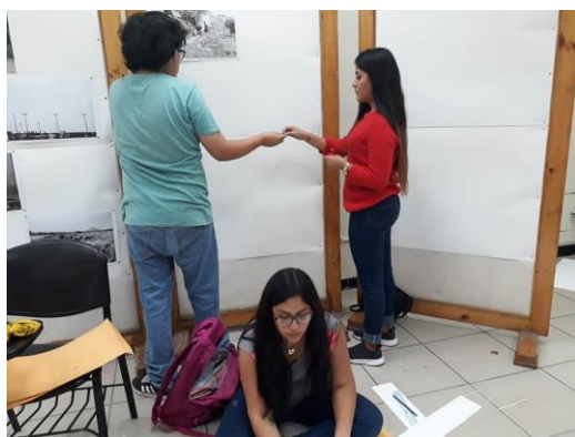
Ilustración 3 Enumeración de fotografías.