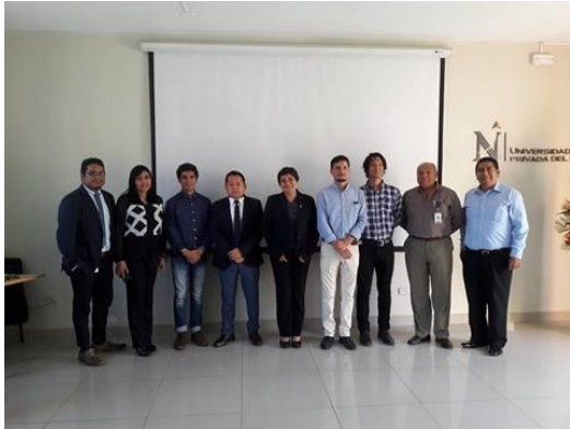
Ilustración 3 Jurado calificador.