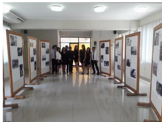
Ilustración 4 Equipo organizador.