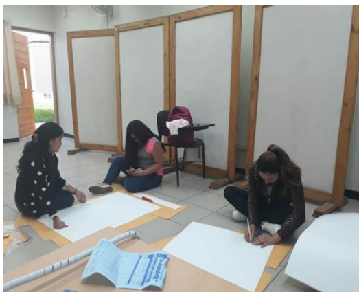
Ilustración 2 Decoración de biombos.

Un arduo trabajo tuvo su finalización con gran éxito el día 19 de Junio del 2017.