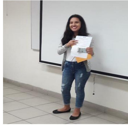
Ilustración 8 Ganadores del concurso.