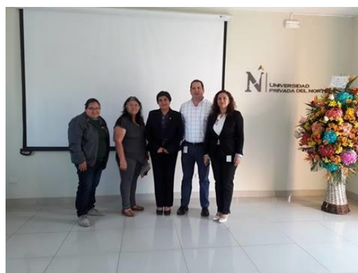
Ilustración 5 Autoridades de la Universidad Privada del Norte y representantes del Centro de Atención de Educación a la Familia (CAEF).