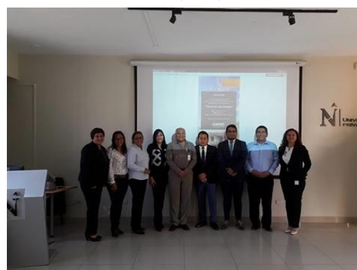
Ilustración 2 Autoridades de la Universidad Privada del Norte.