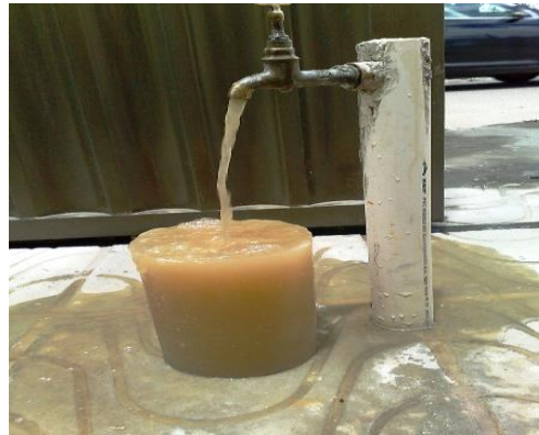
Fig. 3 turbidez del agua

Estos métodos se emplean para reducir la turbidez, y ¿qué se entiende por turbidez del agua?