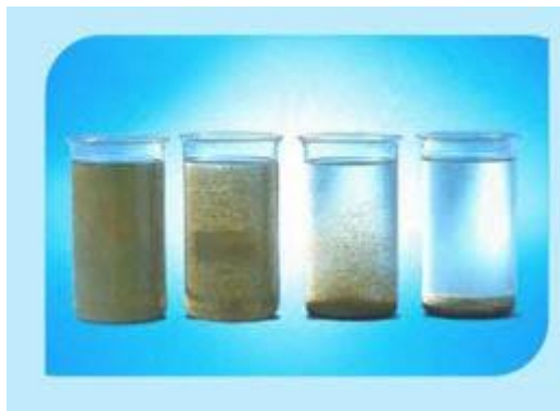
Fig. 2 floculación

Diferentes compuestos naturales extraídos de plantas se han usado para el tratamiento de aguas residuales por muchos siglos. Estos en su gran mayoría derivan de semillas, hojas, cortezas o savia, raíces y frutos de árboles y plantas. En este trabajo se evaluó la utilización del polvo de la semilla de la Cassia fístula como coagulante natural en el tratamiento primario de aguas residuales domésticas. (Tarón et al., 2017)