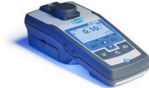
Fig. 4 turbidímetro

En un tratamiento de agua potable la turbidez marca la calidad del agua midiendo con un turbidímetro mientras más turbidez tenga menor es la calidad del agua, porque a mientras más es la turbidez encontrada es más la contaminación del agua a tratar.