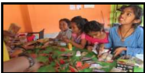
Tabla 9º: Actividad Realizada: Global Day