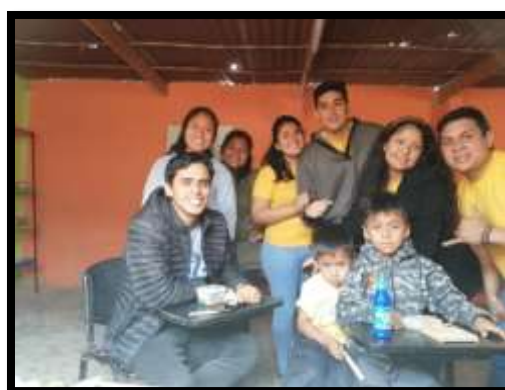
Figura nº 05: Alumno realizando actividades propuestas