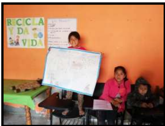
Tabla 5º: 4ta Actividad realizada: 2da sesión de clase “Educación Monetaria”