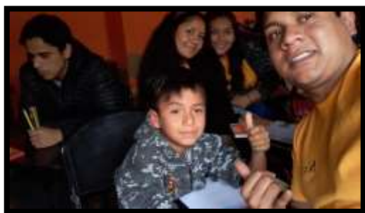
Tabla 6º: Actividad Realizada: Recojo de donaciones