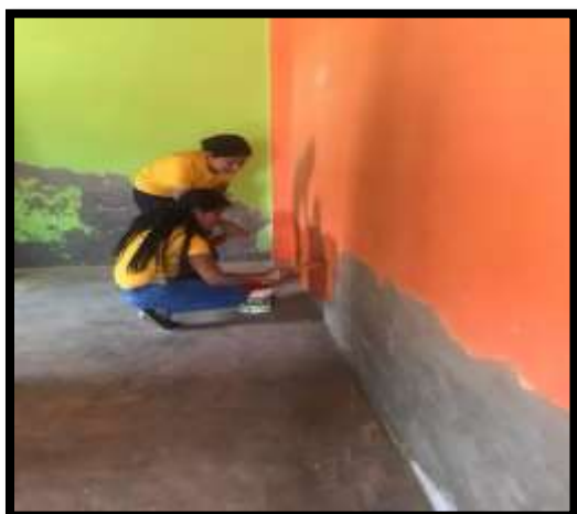
Tabla 10º: Actividad Realizada: 5ta sesión de clase “Juega y Aprende”