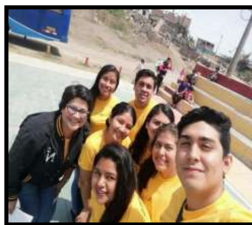
Figura nº 09: Compañeras realizando las tareas del Global Day