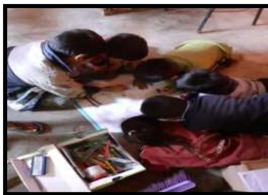
Figura nº 03: Demostración de lo aprendido