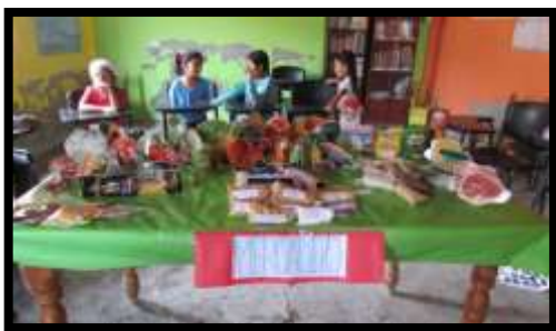
Figura nº 07: Niños simulando compras