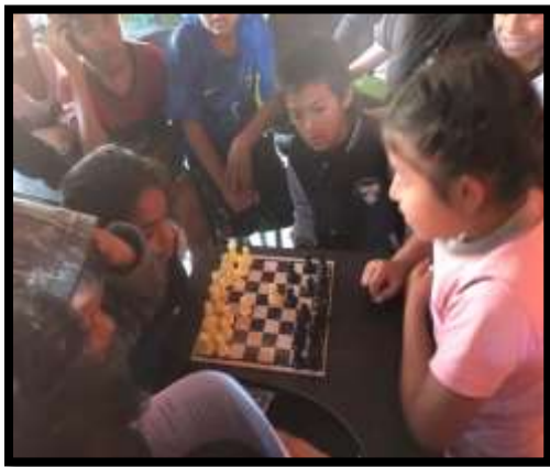
Figura nº 11: Ganador del campeonato de ajedrez