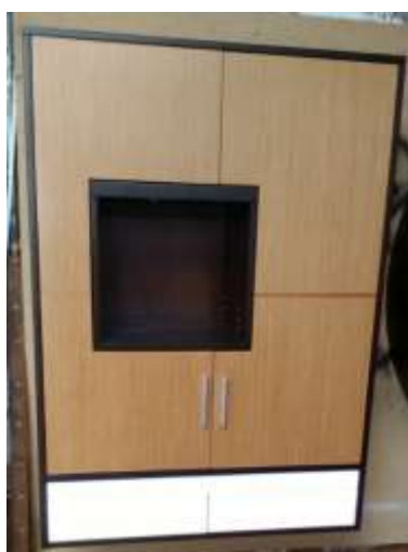
Mueble bar modelo americano