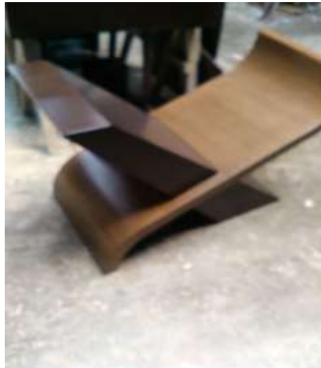
Aparador modelo bizzali