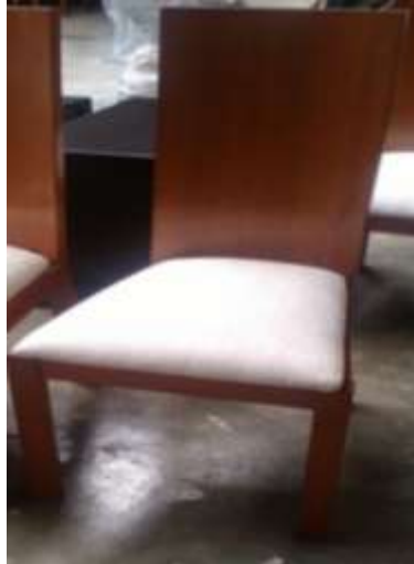
Silla modelo vanity