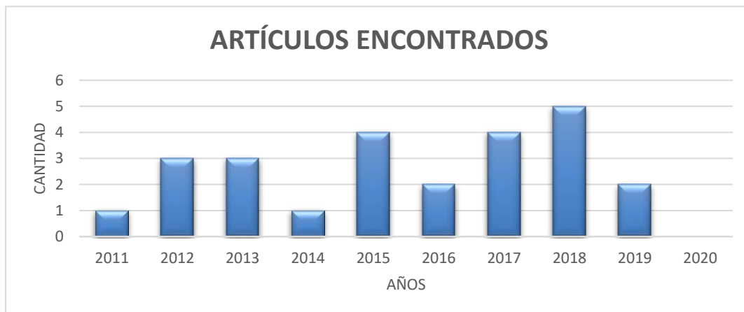
Figura 1 Base de Datos recopilados por año. Se muestra los artículos académicos que fueron publicadas en los años indicados, se puede observar de la importancia del sistema contable en el transcurso del tiempo.