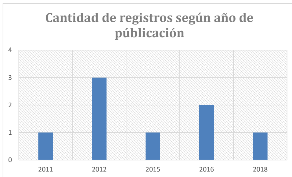
Figura 2: Cantidad de registros según año de publicación