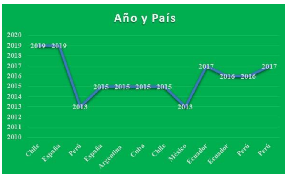
Figura 2: Características de los estudios sobre la “Unión de hecho en la institución de la familia”: una revisión de la literatura científica en el período 2013 – 2019.

Del resultado obtenido de los 12 artículos sistematizados de Dialnet, Scielo, Redalyc, Dspace, Researchgate y otros, se presenta las características de los estudios sintetizados.