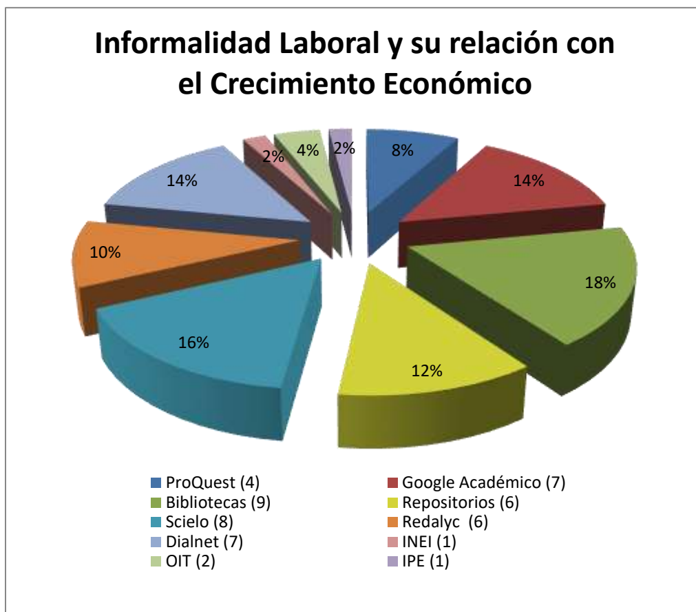
Figura 1: Representación porcentual mediante la selección de Bases de datos

Al realizar la búsqueda de información en la matriz de base de datos se obtuvo un total de 50 estudios entre ellos tesis, revistas, artículos y libros; provenientes de fuente confiable y segura. Distribuidas así: en Bibliotecas, 9 artículos; Scielo, 8 artículos; en Google Académico y Dialnet 7 artículos; en los Repositorios y Redalyc 6 artículos, en ProQuest 4 artículos, en OIT 2 artículos y por último en la INEI e IPE un solo artículo.