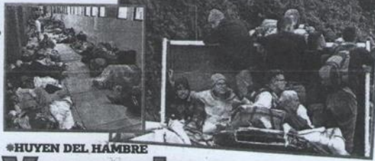
•HUYEN DEL HAMBRE

H uyen de la pesadilla, del hambre y la falta de medicinas. Miran atrás con tristeza, pero regresar es lo último que harían, pues cualquier lugar es mejor por culpa del gobierno de Nicolás Maduro. Abordo de camiones de carga, buses y hasta caminando, miles de venezolanos, muchos de ellos con bebés en brazos, llegaron al puente de Huaquillas, límite de Ecuador con Perú. Ayer fue el último día que podían ingresar al país con sus cedulas de identidad. Desde hoy se les exige el pasaporte, un documento que para muchos es imposible obtener.