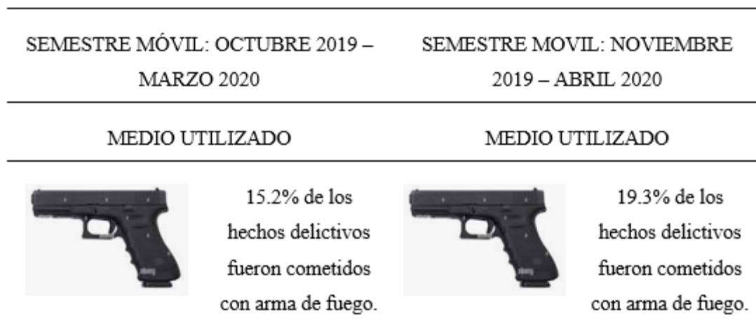
Tabla 8. Porcentaje de Victimización con arma de Fuego

Dicho esto, y una semejanza entre dos (2) semestres alternos en la Región La Libertad para el porcentaje de delitos relacionados con armas, podemos ver que durante el semestre: Octubre 2019 - Marzo 2020, 15.2 infracciones cometidas con esta arma; y, durante el semestre comprendido entre noviembre de 2019 y abril de 2020, el 19,3% cometió delitos utilizando estas peligrosas herramientas (revólveres, pistolas, metralletas u otras similares). En base a estos datos, donde se observa el crecimiento del uso de esta herramienta en un porcentaje de 4.1%, se puede inferir que la proporción de personas de mal que optan por utilizar armas de fuego para realizar sus delitos aumenta cada cierto tiempo merece un trabajo más dedicado y profesional de la Policía Nacional. Asimismo, reformando y aplicando la recientemente emitida Ley N° 31324 “Ley para fortalecer la seguridad de los ciudadanos mediante la entrega voluntaria de armas y municiones lícitas”, en beneficio de los ciudadanos que realmente las requieran para su propia seguridad, previa coordinación para desarrollar una forma de entrega voluntaria con la Policía Nacional y SUCAMEC, los cuales se constituyen como organismos responsables de estas actividades.