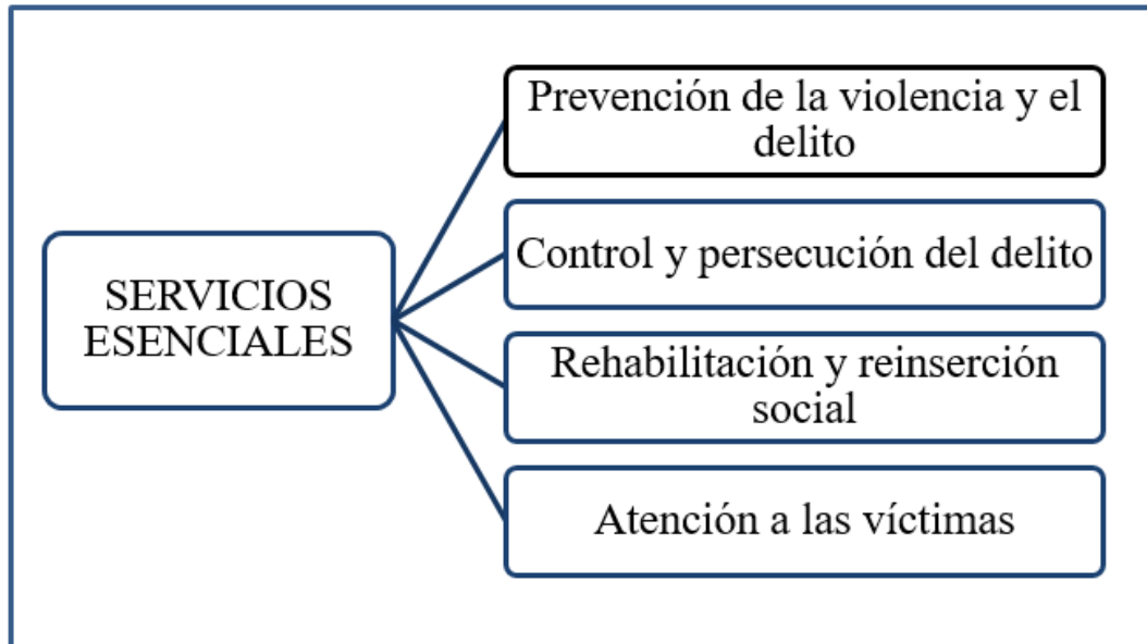
Figura 1. Servicios esenciales de Seguridad Ciudadana

Fuente: Quispe (2020) Seguridad Ciudadana