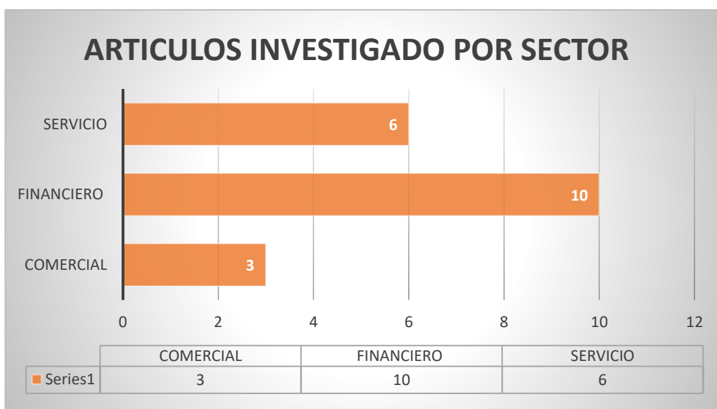
Figura 2. Artículos investigados por sector

En la figura 1 observamos que en el buscador Alicia fue donde encontramos más información para el trabajo realizado.