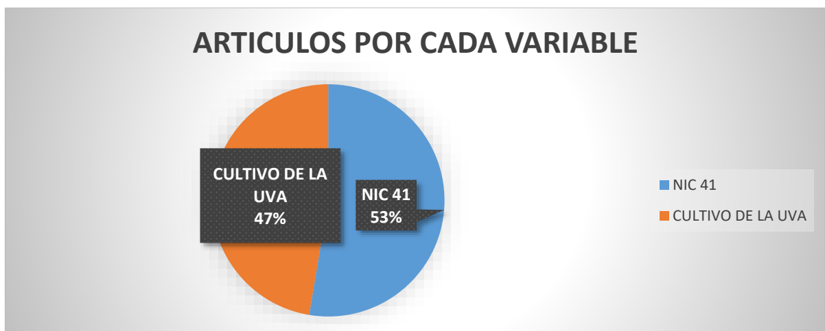
Figura 4. Artículos obtenidos por cada variable

De igual manera se presenta la gráfica 3 que indica la mayor cantidad de artículos de investigación son del año 2019 con un total de 8 artículos.