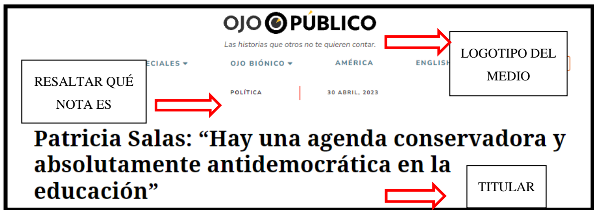
Figura 1. Cabecera de una nota digital del medio Ojo Público

Es importante resaltar que tipo de nota es: De opinión, Editorial, Reportajes, etc. Así debe quedar reflejado en la parte superior de la página. También debes incluir el logotipo.