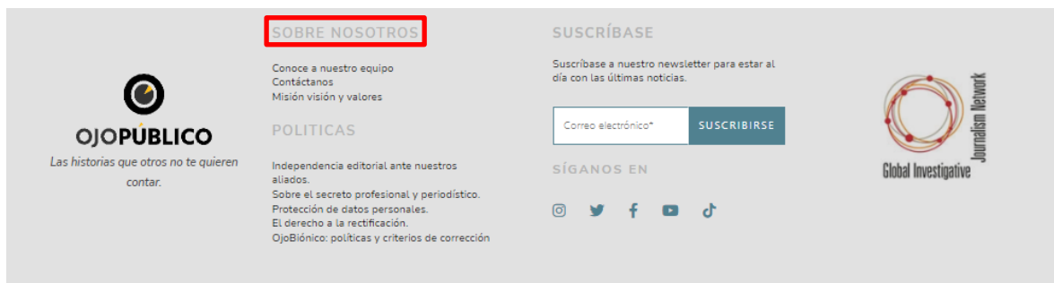
Figura 3. Apartado del medio digital Ojo Público al final de una nota

Para que el público conozca más del medio digital, existe un apartado llamado mayormente “Nosotros” donde brinda datos como la misión, visión y valores que tiene el medio.