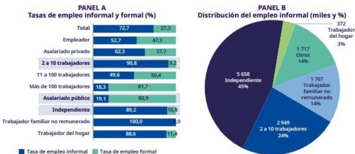
Figura 4. Población ocupada con empleo informal y formal durante el 2019

laboral porque no se implementaron mecanismos de protección ante la pérdida de los ingresos de los trabajadores que fueron suspendidos perfectamente. Ante lo referido, se ha recomendado transitar de la informalidad a la formalidad mediante medidas económicas para generar condiciones que impulsen la creación de empleos formales en los sectores productivos.