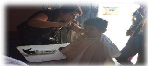
Figura 2: Corte de Cabello