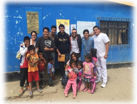
Figura 6: Campaña final odontológica