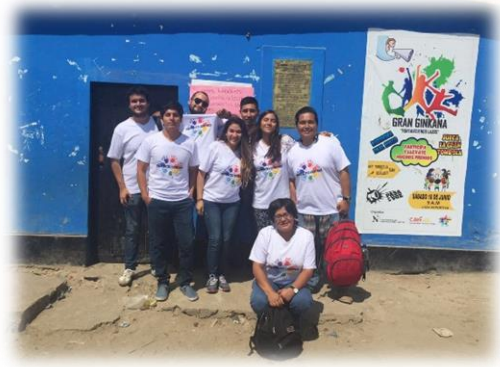
Figura 5: Campaña final de estética

Herrera, J., & Herrera, J. H. J. (2002). La Pobreza en el Perú en 2001.