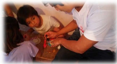
Figura 4: Pintura de uñas.

de la corriente del niño. Según el informe enviado, la municipalidad de moche informó que dicho oficio paso a manos de defensa civil, a los cuales entrevistamos. El reporte de defensa civil informa que el apoyo que realizaron constaba de capacitación para prevenir la corriente del niño y no de apoyo material, defensa civil solo actúa con el apoyo material después de una catástrofe natural, estando reflejada en la ley.